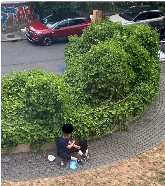
Scène de consommation rue Fendt