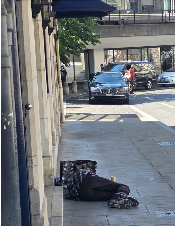
Situation rue de Montbrillant