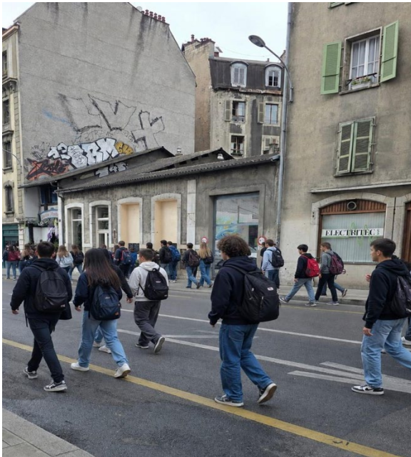
Passage des écolier·e·x·s, Rue Montbrillant en direction de la gare