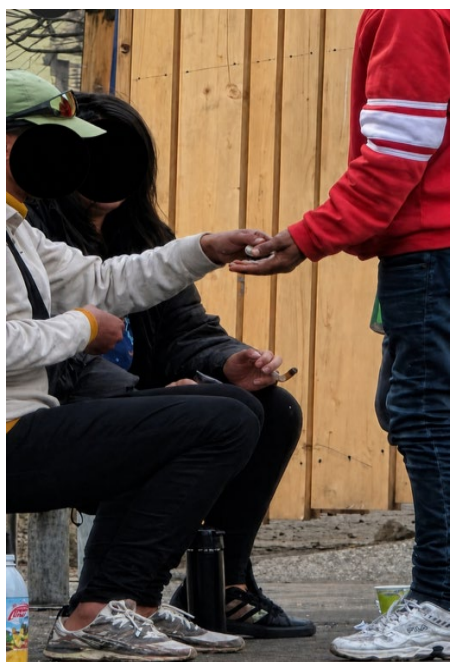
Deal quotidien devant le Quai 9, quartier des Grottes