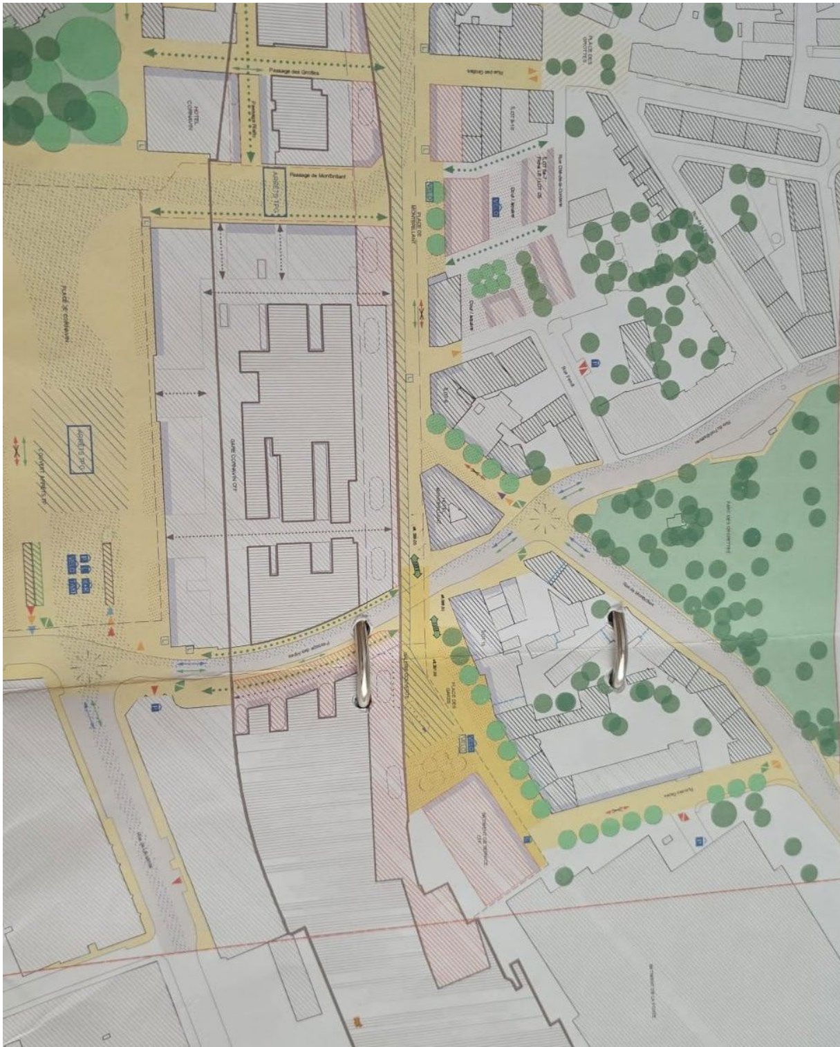
Plan de la zone concernée par les travaux de la Gare Cornavin

Extraits de plans en situation, pendant la phase de chantier, documents de travail, source CFF et Hôtel Montbrillant