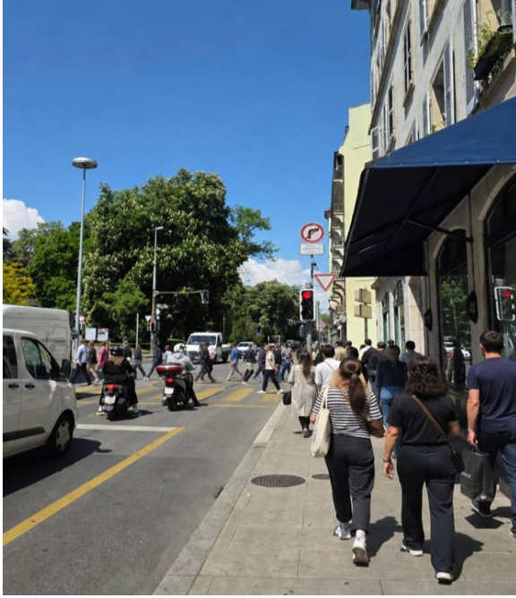
Passage des écolier·e·x·s vers 13:30, Rue Montbrillant, en direction du Parc des Crochettes